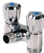
1328 - Double vertical.