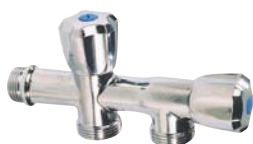
1331 - Double horizontal.