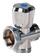
1327 - Intercalaire - Mâle-Femelle.