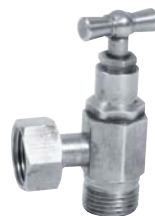
1341 - Dito. Chromé avec presse-étoupe.