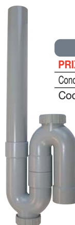
Siphon mâle vertical