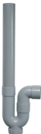
Siphon mâle horizontal