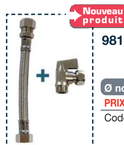
9810991 - Kit W.-C. Flexible 15 cm - 3/8" F. Cuivre Ø 10.