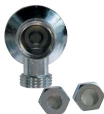
1311 - 1/2" chromée avec 1 écrou Ø 12 et 1 écrou Ø 14.