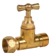
1342 - Droit brossé.