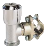
1330 - Autoperceur (chromé).