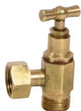
1340 - Equerre-brossé avec presse-étoupe.