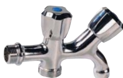
1329 - Machine à laver + puisage.