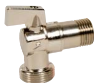
685 - Pour machine à laver (chromé).