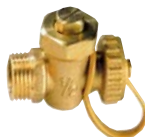
1303 - Mâle bouchon