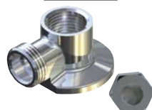
1347 - Applique lourde 1/2" chromée avec écrou.