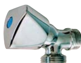
1332 - Modèle lourd. Tête laiton chromé.